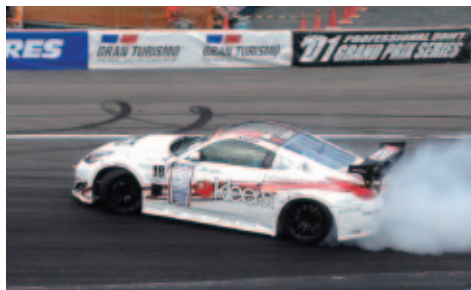
車輛協力：Team BOSS with kleers