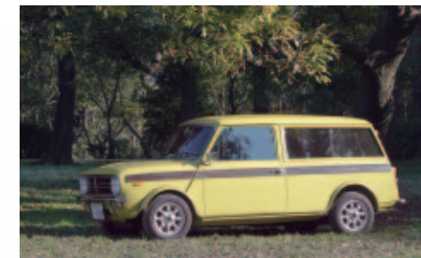
車輛協力：SHIPS Little Cars